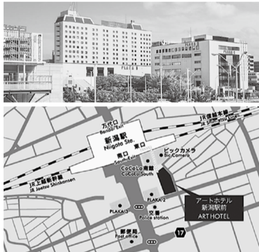
アートホテル新潟駅前 新潟市中央区笹口1-1 (JR新潟駅南口直結) TEL.025-240-2111

なお、新型コロナウイルス感染拡大防止の観点から、懇親会は中止とし、功労賞表彰者ご来賓の皆様方のご臨席をお控えいただくこととなりましたので、ご了承ください。